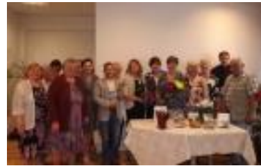
Eiropreģiona “Pleskava – Livonija”

bibliotekāru pieredzes apmaiņas brauciena ietvaros Viļakas novada bibliotēku 20. septembrī apmeklēja bibliotekāri no Krievijas, Igaunijas, Smiltenes, Valkas, Alūksnes, Kārsavas un Ciblas.